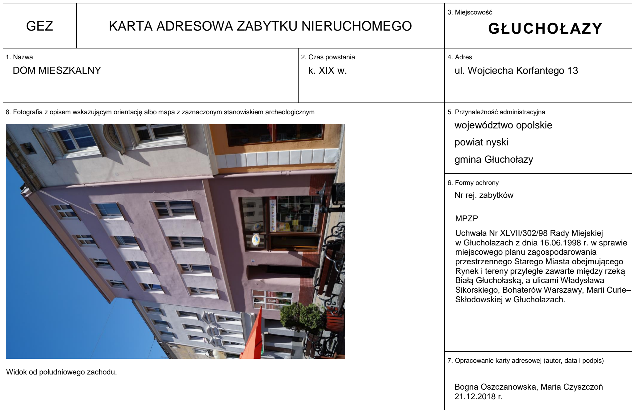
Widok od południowego zachodu.