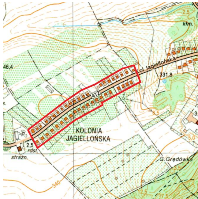
— granica zespołu wyznaczona przez OWKZ. Mapa topograficzna 1:10 000.